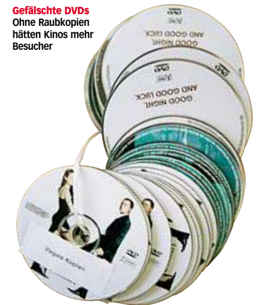
Gefälschte DVDs Ohne Raubkopieren hätten Kinos mehr Besucher

Ein Grund, sich auszuruhen , ist es nicht. Denn unter den Filmpiraten herrscht mittlerweile ein ebenso harter Wettbewerb wie unter Filmemachern: Jeder will der Erste sein oder die qualitativ beste Kopie ins Netz stellen – selbst wenn Ruhm und Ehre der notwendigen Anonymität zum Opfer fallen. Häufig arbeiten die Filmpiraten in Banden: Zunächst beschaffen Leute Film oder Ton, sogenannte Trader platzieren das Material in Tauschbörsen. Das größte dieser Online-Tauschnetze ist BitTorrent, gefolgt von eDonkey. Ein Ex-Raubkopierer, der heute Informant der GVU ist und der Polizei Computeradressen vieler Filmpiraten verschafft hat, berichtet: „Gute Trader haben eine hohe Stellung in der Gruppe.“ Neben denen, die es aus Ehrgeiz tun, gibt es die, die das schnelle Geld suchen, von zwielichtigen Sponsoren etwa.