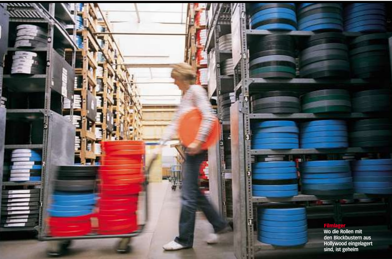
Filmlager Wo die Rollen mit den Blockbustern aus Hollywood eingelagert sind, ist geheim